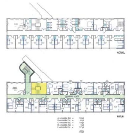
PLAN NIVEAU 2