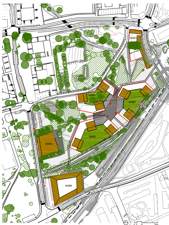
Maison dans le bois: plan général

Le second programme, dit des « maisons dans les bois » dans un environnement végétal dense, sur les communes de Saint Jacques de La Lande et Rennes, regroupe des petits collectifs autour d'un jardin collectif, espace commun de la copropriété. L'approche environnementale développée sur ce projet sera celle mise en oeuvre sur la ZAC.