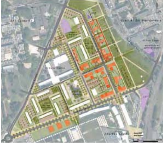
Le site d'expérimentation Villa urbaine durable dans le périmètre de la ZAC des Aviateurs.

de ne pas « privatiser » le nouveau parc public au profit exclusif de l'accession à la propriété.